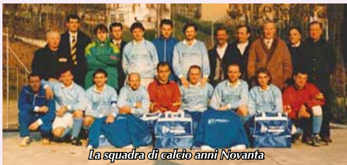
La squadra di calcio anni Novanta