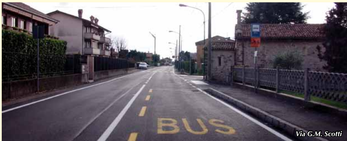
Via G.M. Scotti

Nel mese di Ottobre e Novembre si è dato corso a importanti interventi di manutenzione sia di carattere ordinario che straordinario su alcune vie del territorio dove il manto di asfalto risultava gravemente deteriorato dovuto alle condizioni climatiche intervenute nel corso degli anni, ma altresì presentava avvallamenti sensibili dovuti ai vari assestamenti riferiti in particolare ai numerosi interventi effettuati per i nuovi allacci e/o alla posa di nuovi sottoservizi quali; Metano, Enel, Telecom, nuovi condotti fognari, nuove caditoie per lo smaltimento di acque meteoriche.