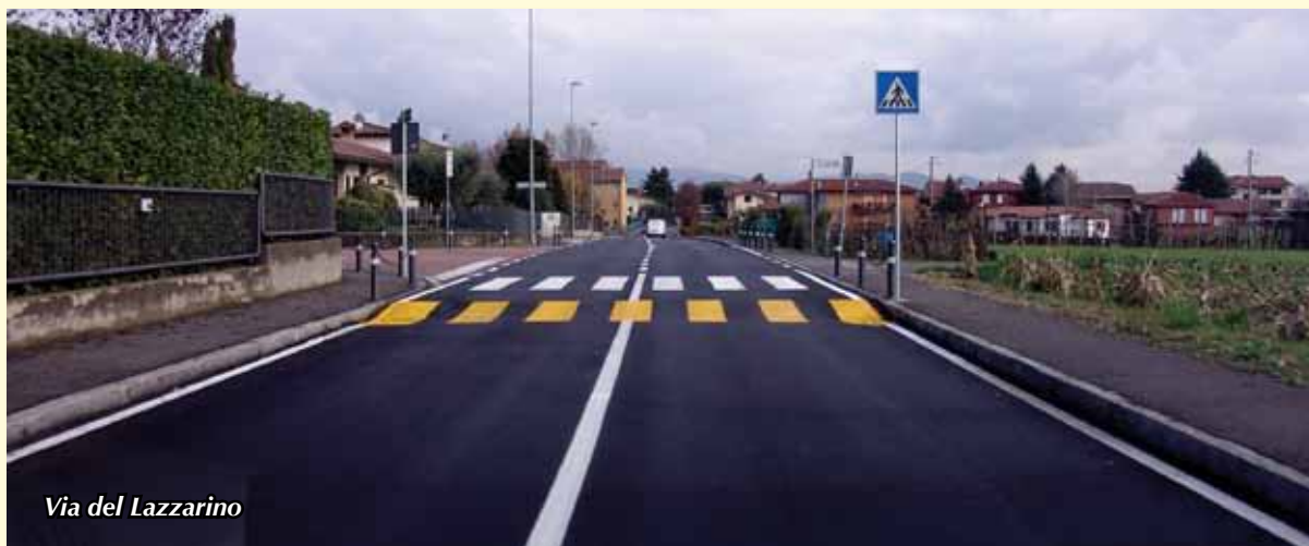
Via del Lazzarino

Il Costo dei lavori di manutenzione delle strade è stato pari a € 77.422.16.