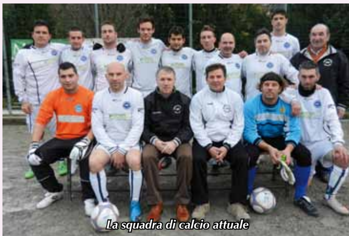
La squadra di calcio attuale