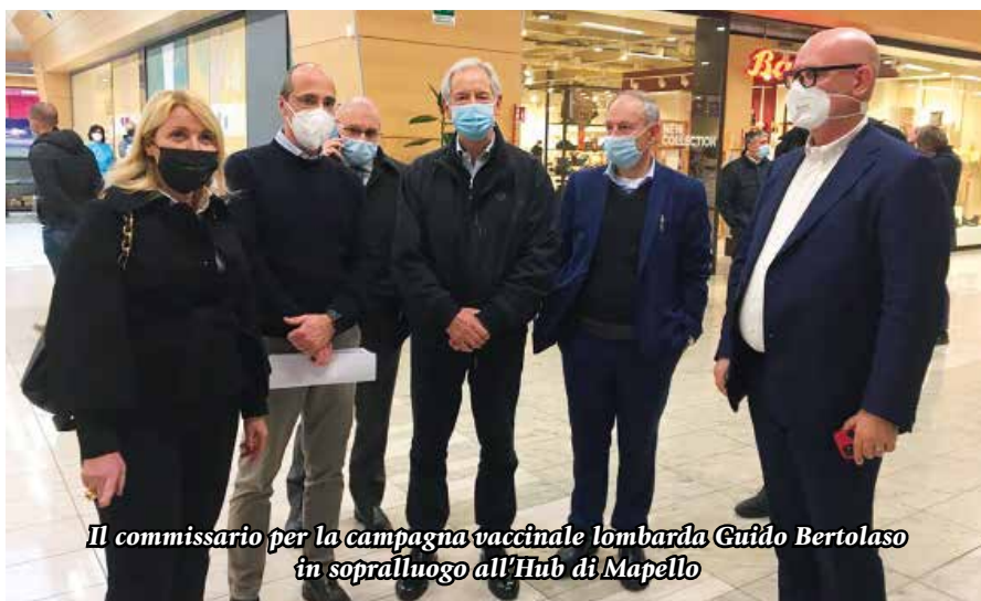
Il commissario per la campagna vaccinale lombarda Guido Bertolaso in sopralluogo all'Hub di Mapello