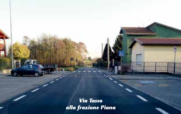
Via Tasso alla frazione Piana