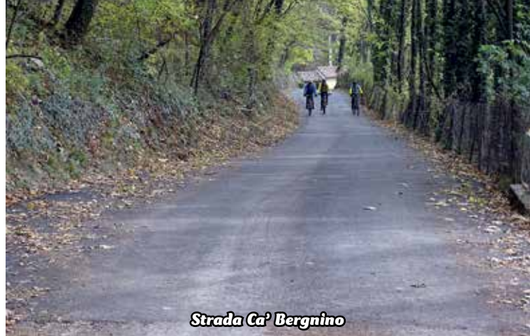
Strada Ca' Bergnino

nali e per tempi brevissimi, quindi non ripetibili, per poter effettuare questi investimenti svincolati dal patto, utilizzando ovviamente risorse già nelle disponibilità del Comune. L'Amministrazione Comunale, sfruttando tempestivamente tale possibilità, ha scelto di dare priorità alla sistemazione di questi tratti di strada, insieme ad altre opere pubbliche ben illustrate nello scritto del Sindaco e pubblicato su questo stesso notiziario. Tra queste figura anche la realizzazione del marciapiedi in via XI Febbraio, nel tratto compreso tra la via Agazzi e la via Bolis, opera per la quale disponiamo già del progetto, da tempo predisposto. Se verrà trovata la disponibilità dei proprietari delle aree interessate dalla realizzazione del marciapiedi, confidiamo di poter appaltare l'opera entro la prossima primavera.