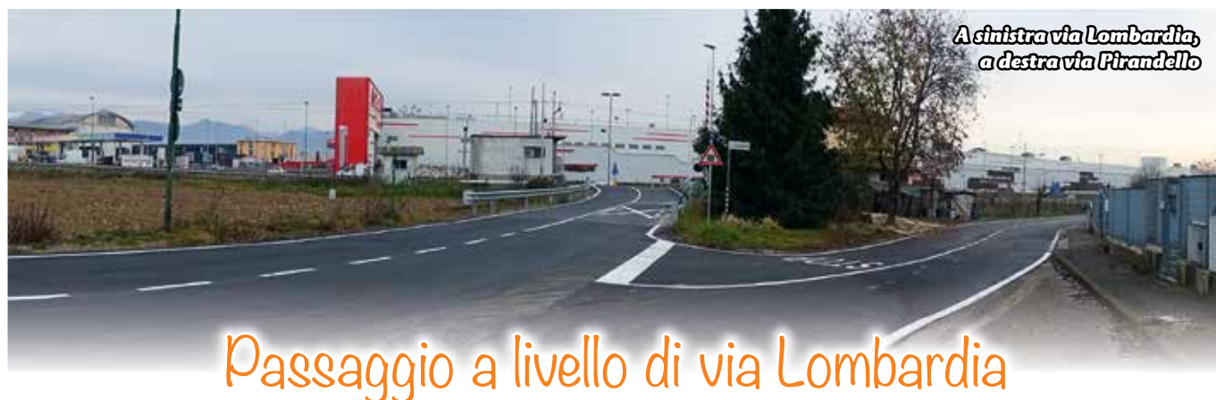
Passaggio a livello di via Lombardia