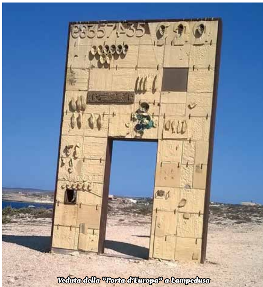
Veduta della "Porta d'Europa" a Lampedusa

Penso a quanti operano nella Caritas interparrocchiale che nella primavera scorsa, stimolati dai sacerdoti dell'Unità Pastorale Mapello Valtrighe Ambivere, si sono interrogati su come dare la possibilità di una permanenza dignitosa ai tanti profughi in arrivo, rispetto all'accoglienza in macro-strutture spesso sovraffollate e inospitali.