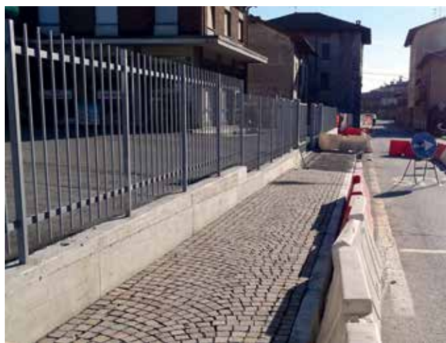
Lavori di realizzazione nuovo marciapiede su via XI Febbraio (Mapello)