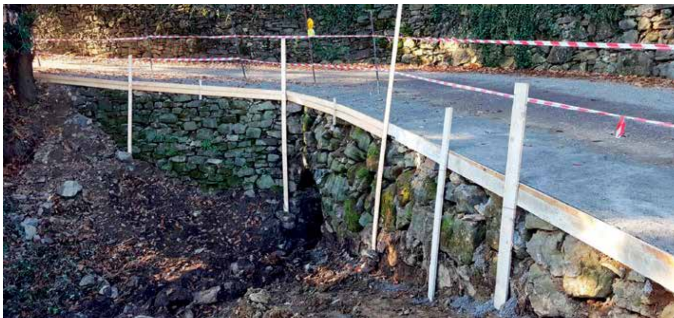
Consolidamento, messa in sicurezza e costruzione di muretto di contenimento in pietra, in via Cabergnino