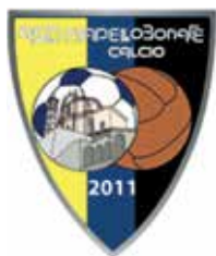
Scuola Calcio Elite FIGC