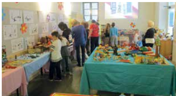
Mostra di giugno: "Giochi di ogni tempo"