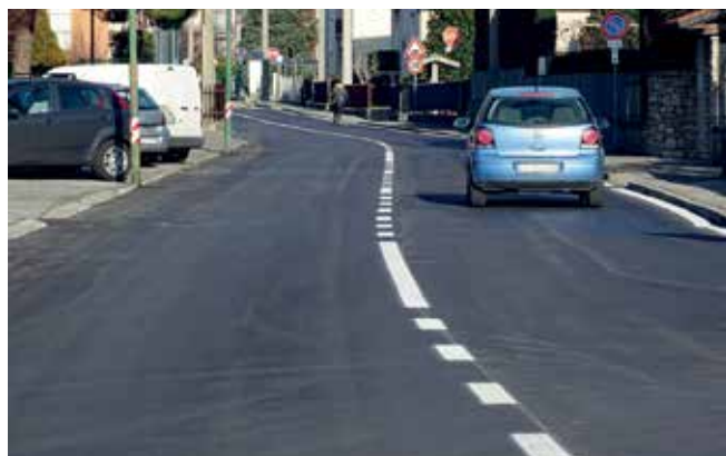
Interventi di asfaltatura su via Tasso (Piana) e via Gandolfi (Prezzate)